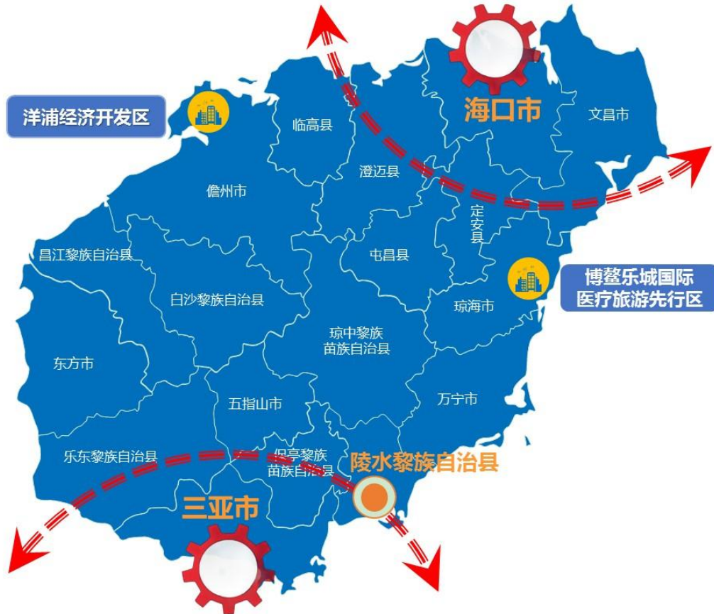
图 1 海南国际设计岛产业发展空间布局图